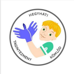
Hegyháti Alajos Tagintézmény KÖMLŐD