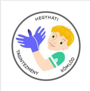
Hegyháti Alajos Tagintézmény KÖMLŐD