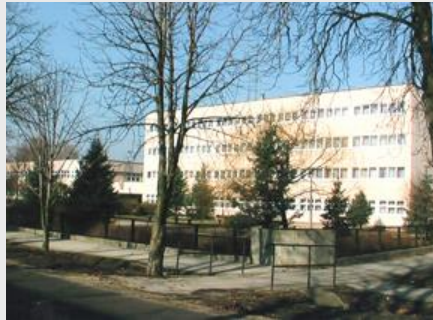
KEM-i Óvoda, Általános Iskola, Speciális Szakiskola, Kollégium és Gyermekotthon TATA